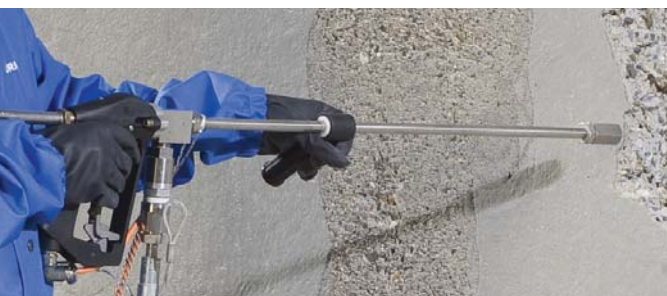
Einzeldüse / Individual Nozzle